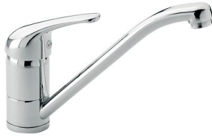
Monomando S1000 - RO 8443 002